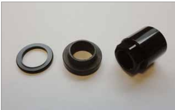
Small Service-Kit Schwarz