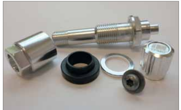
Full Service-Kit Silber