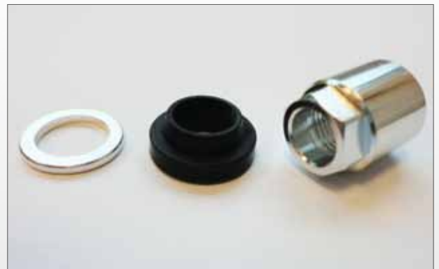
Small Service-Kit Silber