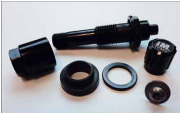
Full Service-Kit Schwarz